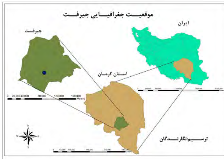
شکل ۲- موقعیت جغرافیایی محدوده مورد مطالعه

در حال حاضر شورای اسلامی شهر جیرفت متشکل از ۱۱ عضو است (۱۰ نفر مرد و ۱ نفر زن). اهم فعالیت‌های شورای شهر جیرفت عبارت است از: ۱- در سال‌های اخیر اقدامات عمرانی با حجم بالایی برای توسعه شهر جیرفت صورت گرفته است، ۲- تشکیل چند جلسه مشورتی با جوانان تحصیلکرده در زمینه‌های مختلف و مهم‌تر از همه اعتماد به آنها، ۳- ایجاد فضاهای سبز منظم و بوستان‌ها و پارک‌های شهری و محله‌ای و مراکز تفریحی برای گذراندن اوقات فراغت به خصوص در ایام تعطیل، ۴- فعالیت در زمینه تربیت نیروی متخصص برای اداره شهر در آینده، ۵- احداث پارکینگ و مکان‌های توقف‌گاهی در اطراف مرکز تجاری شهر برای کاهش ترافیک با توجه به شلوغی این خیابان‌ها (شورای شهر جیرفت، ۱۳۹۴).