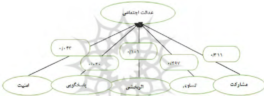
شکل ۳. مدل رگرسیونی چند متغیره بین متغیر مستقل و وابسته

همبستگی مرتبه صفر ۱ که مقدار آن معادل مقدار ضریب همبستگی پیرسون است، میزان همبستگی بین متغیرها را بدون وجود متغیر کنترل نشان می‌دهد. همچنین ضریب همبستگی جزئی ۲ نوعی کنترل آماری است که از طریق آن می‌توان اثر یک یا چند متغیر را کنترل کرد (حبیب پور و صفری، ۱۳۸۸) هر چه میزان این همبستگی برای یک متغیر بیشتر باشد، نقش آن در مدل بیشتر است. براساس این ضریب نیز متغیر اعتماد غیرشخصی، بیشترین نقش را در وضعیت متغیر وابسته دارد. همبستگی نیمه تفکیکی ۳ نوعی کنترل آماری است که از طریق آن می‌توان اثر یک یا چند متغیر را کنترل کرد. این ضریب، میزان همبستگی بین یک متغیر مستقل با متغیر وابسته را پس از حذف اثر خطی سایر متغیرهای مستقل بر متغیر مستقل مورد نظر نشان می‌دهد در این همبستگی نیز هرچه میزان بیشتر باشد، نقش آن در مدل بیشتر است (حاتمی نژاد و همکاران، ۱۳۹۵: ۳۵۸).