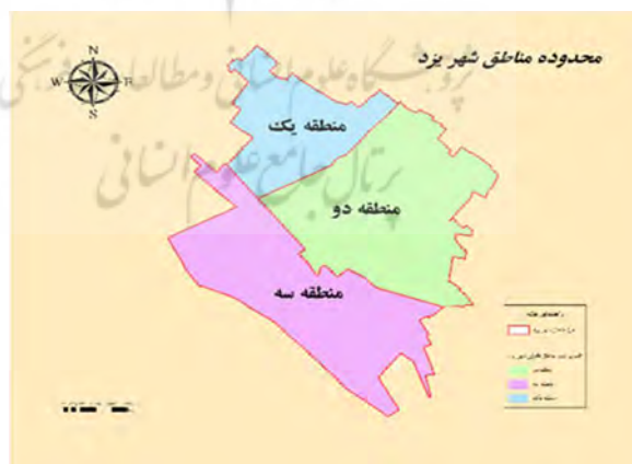
نقشه شماره ۲: تقسیمات کالبدی شهر یزد

شهر یزد طبق نقشه شماره ۲ دارای سه منطقه شهری می‌باشد که محلات زیادی از منطقه یک و دو جزء هسته‌های اولیه شهر و بافت قدیم بوده و منطقه سه در سالهای اخیر در پی گسترش و توسعه فیزیکی شهر یزد شکل گرفته است (حکمت‌نیا، ۱۳۹۳: ۵).