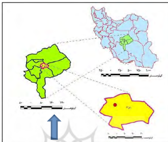
نقشه شماره ۱: موقعیت شهر یزد در کشور، استان و شهرستان (مأخذ: دفتر فنی استانداری)

به استان اصفهان محدود گشته است. آب و هوای یزد به علت قرار داشتن بر روی کمربند خشک جهانی دارای زمستانهای سرد و نسبتاً مرطوب و تابستانهای گرم و طولانی و خشک است (yazdcity.ir).