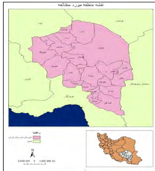
شکل شماره ۱- موقعیت استان کرمان