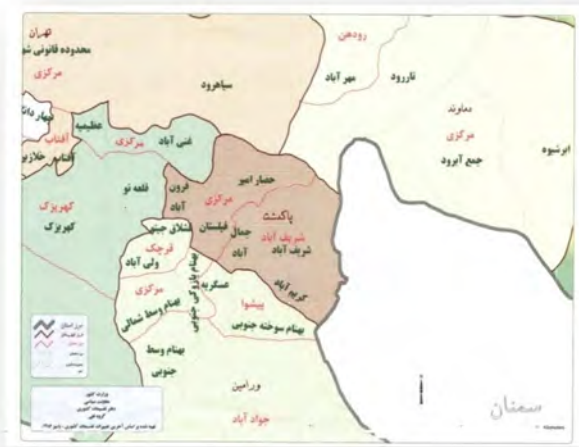
نقشه (۱): موقعیت نسبی شهرستان پاکدشت