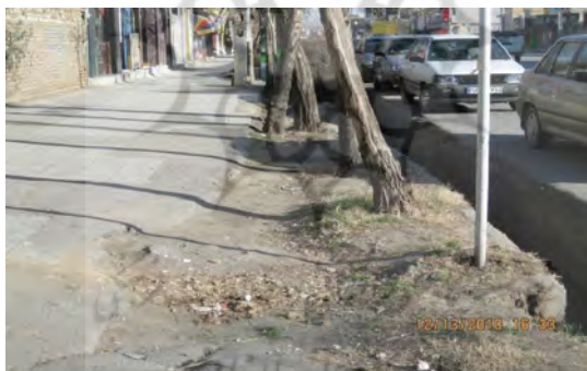
تصویر شماره (۳) نمای از معابر خیابان شهدا مأخذ: مطالعات میدانی نگارندگان زمستان ۱۳۹۵