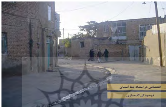
تصویر شماره (۱) نمای از معابر بخش مرکزی شهر مأخذ: مطالعات میدانی نگارندگان زمستان ۱۳۹۵

کالبد و سیمای شهر خطرات جمعی شهروندان و حافظه تاریخی شهر مستتر شده‌اند و با گذر زمان روایتگر گذشته و هویت شهر به نسل‌های بعدی خواهند بود. با این حال آنچه در ملایر امروز مشهود می‌باشد نبود سبک و قاعده‌ای خاص در زمینه پرداختن به مسائل مرتبط با سیمای شهری است. فراروندی که آشفتگی و نابسامانی را در سیمای شهری سبب شده و از این زاویه تأثیر نامطلوبی را به صورت خودآگاه و ناخودآگاه بر حوزه‌های ادراک روانی شهروندان و نیز روان‌شناسی محیطی بر جای گذاشته است.