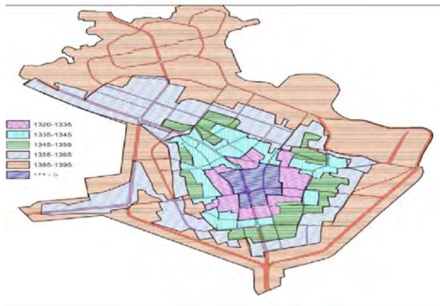
نقشه شماره (۳) مراحل توسعه شهر ملایر