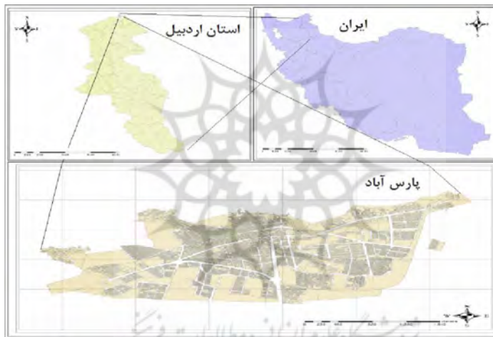
شکل ۱: موقعیت محدوده مورد مطالعه

هسته اولیه شهر شامل محله مسجد جامع، مسجد عباسیه و محله درویش‌آباد مربوط به قبل از سال‌های ۱۳۲۲ مرحله دوم توسعه شهر مربوط به خانه‌های کارکنان شرکت مهندسی شیار در سمت شرق مربوط به سال‌های ۱۳۳۲-۵۶ و در نهایت مرحله سوم مربوط به توسعه شهر در سال‌های ۶۵-۷۵ در سمت جنوب شرقی، شمال و سپس منتهی‌الیه شرقی و غربی شهر می‌باشد (طرح جامع شهر پارس‌آباد، ۱۳۹۰).