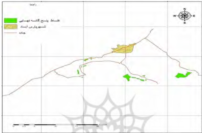
شکل ۷: نقاط پنج‌گانه نهایی به منظور احداث آرامستان برون شهری پارس آباد مأخذ: نگارنده، ۱۳۹۴

در نهایت مناطق پنج‌گانه نهایی در قسمت‌های غربی، جنوبی و جنوب شرقی شهر مورد مطالعه، با بهترین درجات عضویت و فواصل مختلف نسبت به شهر و عوارض و ویژگی‌های مورد مطالعه آن در شکل شماره (۸) تفکیک و پیشنهاد می‌شود. در جدول شماره (۸) نیز اطلاعات کمی این نقاط پنج‌گانه شامل میزان درجه عضویت و فواصل آن‌ها به تفصیل ذکر شده است.