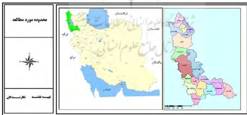
شکل ۱: موقعیت استان آذربایجان غربی در کشور

استان آذربایجان غربی در شمال غربی کشور واقع شده و مرکز آن شهر ارومیه می باشد. بر اساس سرشماری سال ۱۳۹۰ جمعیت این استان ۳۰۸۰۵۷۶ نفر بوده، که حدود ۴/۱ درصد از جمعیت کشور را شامل می شود و از لحاظ مساحت نیز ۲/۳ درصد از سطح کشور را در بر گرفته و شامل ۳۶ شهر می باشد. متوسط رشد سالانه جمعیت استان طی سال های ۹۰-۸۵ حدود ۱/۴۰ درصد بوده و بعد خانوار در این استان نیز برابر با ۳/۷ می باشد. تعداد کل واحدهای مسکونی کشور در سال ۹۰ برابر با ۱۹۹۵۴۷۰۸ واحد مسکونی بوده که از این تعداد، ۷۲۴۴۹۲ واحد مسکونی در استان آذربایجان غربی قرار دارد و بدین ترتیب ۳/۶۳ درصد از واحدهای مسکونی کل کشور را شامل می شود (مرکز آمار ایران، ۱۳۹۰).