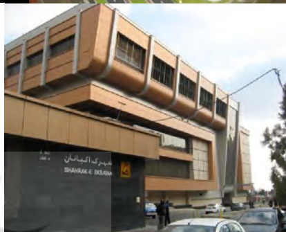
تصویر شماره ۵: نمایی از مجتمع ایستگاهی اکباتان دی ماه ۱۳۹۳