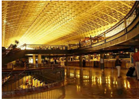
تصویر شماره ۴: مجتمع ایستگاهی مترو در شهر واشنگتن