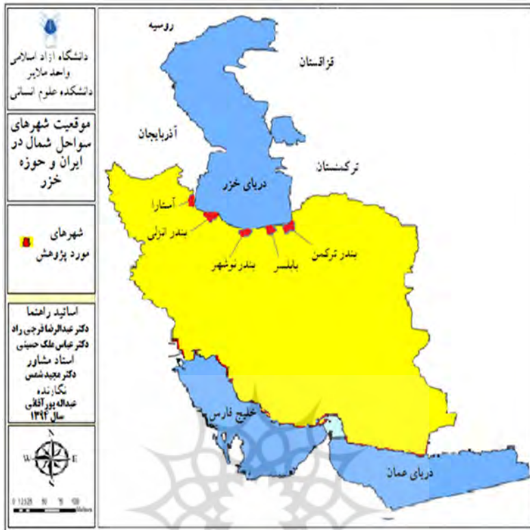
نقشه ۱. موقعیت شهرهای ساحلی در شمال ایران

از مجموع جمعیت حدود ۱۲ میلیونی ساکن در سواحل دریای خزر حدود ۶ میلیون نفر در جنوب خزر یعنی در سواحل استانهای شمالی ایران ساکن هستند. به علت موقعیت قرارگیری کوههای البرز و اقلیم ساحل جنوبی و عمق بیش تر، سواحل ایران از طبیعت و موقعیت بهتری نسبت به سواحل کشورهای دیگر برخوردار است و دارای پتانسیل های متنوعی برای سرمایه گذاری از جمله گردشگری است؛ در صنعت توریسم هنوز خلاءهای بسیاری برای سرمایه گذاری و مدیریت دارد که با ساماندهی نوار ساحلی و مدیریت فضای فرهنگی و سیاسی منطقه، توریسم می تواند اشتغال و توسعه اقتصادی منطقه را بدنبال داشته باشد. موردی که به فراموشی سپرده شده است. در طول این ساحل ۷۵۰ کیلومتری ما فعالیت های محدودی مشاهده می کنیم که این فعالیت ها به هیچ وجه قابل مقایسه با فعالیت هایی که کشورهای دیگر در رابطه با توسعه شهرهای ساحلی خود داشته اند و از آن طریق کشورهای خود را به پیشرفت و رفاه رسانده اند، نمی باشد، لذا ضروری است که جهت انجام این امر طرح ملی بزرگی