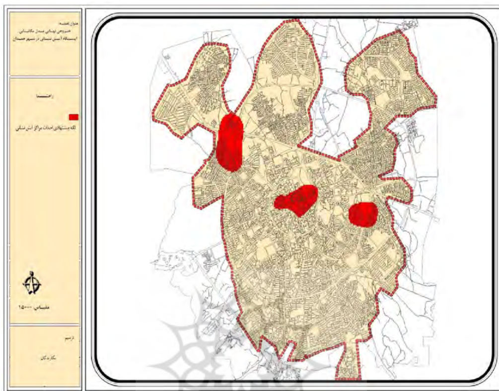
نقشه ۳: لکه‌های پیشنهادی ایستگاه‌های آتش‌نشانی ترسیم از نگارندگان

پس از تعیین ۳ لکه‌ی پیشنهادی تلاش شد تا با استفاده از روش هم‌پوشانی لایه‌ها و بر اساس منطق خوشه‌ای اولویت‌بندی پهنه‌های مورد نیاز نیز بررسی شد. بر اساس منطق خوشه‌ای اولویت‌بندی احداث ایستگاه در پنج دسته خواهد بود. این پنج دسته که با طیف رنگی آبی تا قرمز در نقشه ۴ مشخص شده‌اند نمایانگر اولویت مناطق نیازمند ایستگاه خواهد بود. بر طبق این نقشه، نقاط قرمز که همان لکه‌های پیشنهادی پژوهش هستند، در اولویت اول به جهت احداث ایستگاه آتش‌نشانی در شهر همدان خواهند بود. نقاط صورتی نیز در اولویت دوم قرار دارند. این نقاط که حوزه‌بلافاصل لکه‌های اولویت اول هستند، ضلع جنوب شرقی شهر را نیز در بر می‌گیرد. در مرحله بعد نقاط زرد هستند که با اولویت متوسط احداث ایستگاه آتش‌نشانی خواهند بود. این نقاط همانطور که در نقشه مشخص شده حوزه‌بلافاصل لکه‌های اولویت دوم خواهند بود. نقاط با رنگ آبی کم‌رنگ، در اولویت چهارم هستند. این نقاط بیش‌ترین محدوده را در نقشه تهیه شده