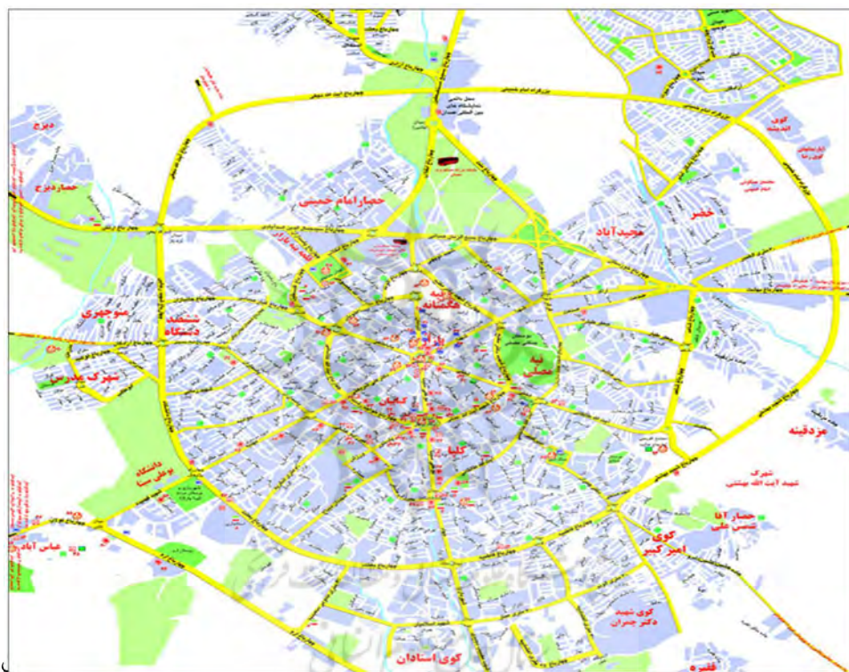
نقشه ۱: نقشه شهر همدان

نقشه شماره ۱ موقعیت شهر همدان را در سال ۱۳۹۴ نشان می‌دهد.