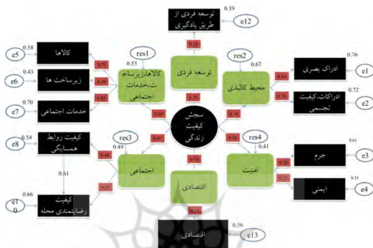
نمودار ۲-مدل سنجش کیفیت زندگی در محله کوی ملت

در این مرحله آزمون تأیید عاملی، مورد بررسی قرار گرفته، بنابراین مدل ابتدایی با حذف دو متغیر و ارتباط کواریانسی رد و مدل نهایی در محله مورد نظر باتوجه به ویژگی‌های خاص خود، به قرار زیر می‌باشد.