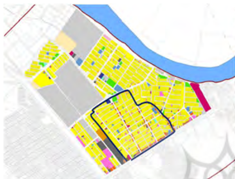
تصویر ۲- عکس هوایی محله کوی ملت

علاوه بر کاربری مسکونی، سایر کاربری‌های شهر نیز طراحی و پیش‌بینی شده است و کاربری‌های غیر مسکونی مانند تجاری، اداری، آموزشی و ... در لبه خیابان‌های اصلی جای گرفته و در عمق تنها کاربری‌های مسکونی شکل گرفته‌اند. از جمله بافت‌های طراحی شده در سطح شهر اهواز می‌توان به محلات کیان‌پارس، زیتون و کوی ملت اشاره کرد (مهندسین مشاور معماری و شهرسازی عرصه، ۱۳۸۸).