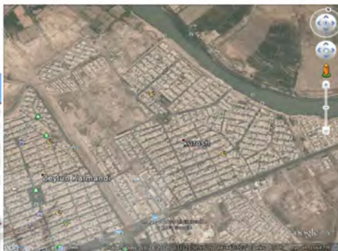
تصویر ۱- کاربری اراضی و محدوده فاز یک در کوی ملت اهواز