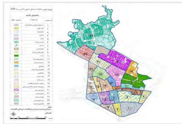
نقشه‌ی شماره ۲: نقشه‌ی محله بندی شهر ملایر با GIS