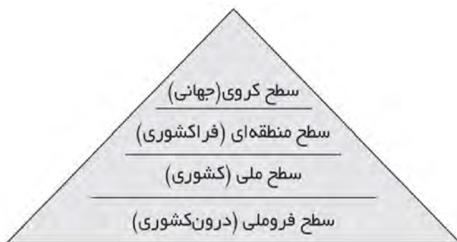
شکل ۱- الگوی ساختاری ژئوپلیتیک جهان

با تأکید بر مطالب فوق موارد فوق الگوی سطوح ساختار ژئوپلیتیکی جهان نشان می دهد تعادل در سطح فرو ملی یا درون کشوری سبب افزایش قدرت سیاسی و ژئوپلیتیک در بعد ملی، منطقه ای و کروی می شود (www.ghalibaf.ir).