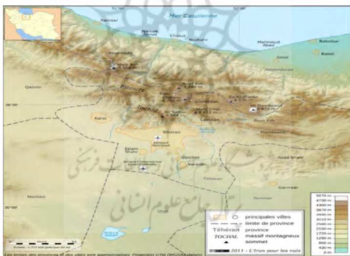
نقشه ۳- شرایط توپوگرافی تهران و تاثیر گذاری بر توزیع جمعیت

شرایط توپوگرافی اطراف تهران هم گویای ویژگی های متفاوت امنیتی در اطراف این کلان شهر است.