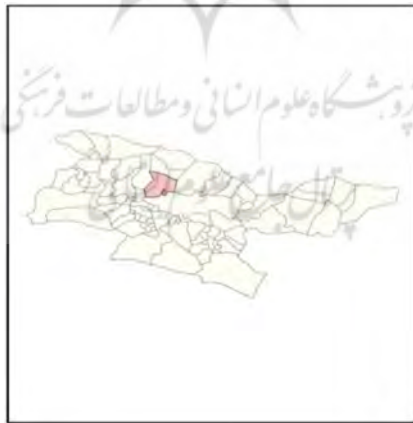
شکل ۲ - موقعیت سولقان در محدوده شهر تهران