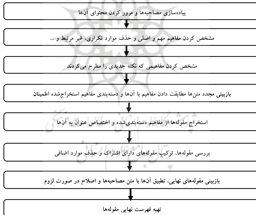
نمودار (۱) مراحل تحلیل داده‌های حاصل از مصاحبه‌های کیفی

برای تحلیل داده‌ها از روش تحلیل تفسیری استفاده شد. در این پژوهش بر اساس اصول و چهارچوب عملی آن در حد امکان، به آشکار کردن پیام‌های نهفته در متن نوشتاری مصاحبه اقدام شد. بر این اساس، با مرور ادبیات پژوهش، درباره اینکه چه موضوعات و مفاهیمی باید برای رمزگذاری انتخاب شود، تصمیم‌گیری و مفاهیم متناسب با آن‌ها از داده‌های حاصل از مصاحبه استخراج شد. تحلیل مصاحبه‌ها با اقتباس از مراحل پیشنهادی رایین (۲۰۰۵) از الگوی تحلیل تفسیری و طی مراحل گام‌های زیر انجام گرفت: