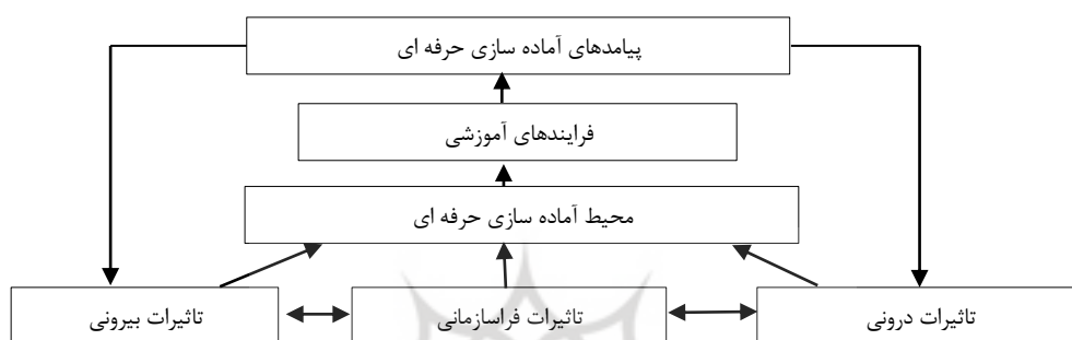
شکل ۱: چهارچوب برنامه های آماده سازی حرفه ای (استارک و همکاران، ۱۹۸۶: ۲۳۷)

آموزشی ۲) تعامل دانشجویان با اعضای هیئت علمی مجموعه آموزشی ۳) تعامل دانشجویان با دانشجویان دیگر حاضر در همان برنامه آموزشی (براک ۱ ، ۱۹۷۶: ۱۰). استارک ۲ و همکاران ۳ (۱۹۸۶) مدل تعاملی دیگری در ارتباط با جامعه پذیری علمی ارائه می دهند که دارای عناصر شناختی و عاطفی بوده و شامل متغیرهایی چون تأثیرات بیرونی، سازمان درونی، جنبه های برنامه تحصیلی و پیامدهای مورد انتظار است.