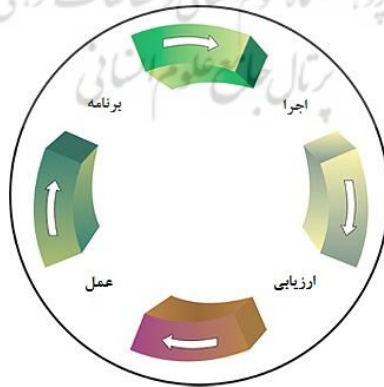
شکل ۱: چرخه بهبود بهره‌وری

از سوی دیگر، محدودیت منابع، سرعت و کیفیت ارائه خدمات، تشدید رقابت و ضرورت انجام هدفمند امور، زمینه توجه به عملکرد دانشگاه‌ها را فراهم کرده است. یکی از راه‌های ارزیابی عملکرد، ارزیابی و سنجش کارایی است. اندازه‌گیری کارایی و شناسایی عوامل مؤثر بر آن، بخشی از مدیریت چرخه بهبود بهره‌وری به حساب می‌آید. به‌منظور برنامه‌ریزی صحیح و عملی برای رسیدن به این هدف، احتیاج مستمر به اندازه‌گیری کارایی و همچنین بررسی عوامل مؤثر بر آن در دوره‌های مختلف دانشگاه‌هاست.