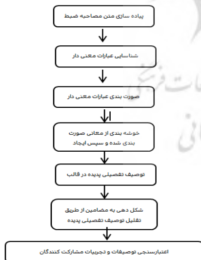
شکل ۱- فرایند تحلیل داده‌های پدیدارشناختی با استفاده از روش کلایزی

داده‌ها طبق رویکرد پدیدارشناسی توصیفی- Colaizzi تحلیل شد، سپس درون مایه‌های اصلی استخراج شد. این روش قادر است به روشنی و وضوح مرحله به مرحله محقق را در رسیدن به جوهره تجارب هدایت کند. این روش، ارائه دهنده‌ی درک عمیقی از تجربیات افراد در توصیفات آنها می‌باشد (Belle, 2014). روش تجزیه و تحلیل داده‌ها براساس مدل پیشنهادی Colaizzi شامل ۷ مرحله است که در قالب شکل زیر نشان داده شده است.