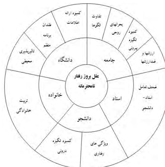
شکل ۱- علل بروز رفتارهای نامحترمانه دانشجویان براساس دیدگاه استادان

۴- در صورت لزوم، استفاده از ابزار و مراجع قانونی.