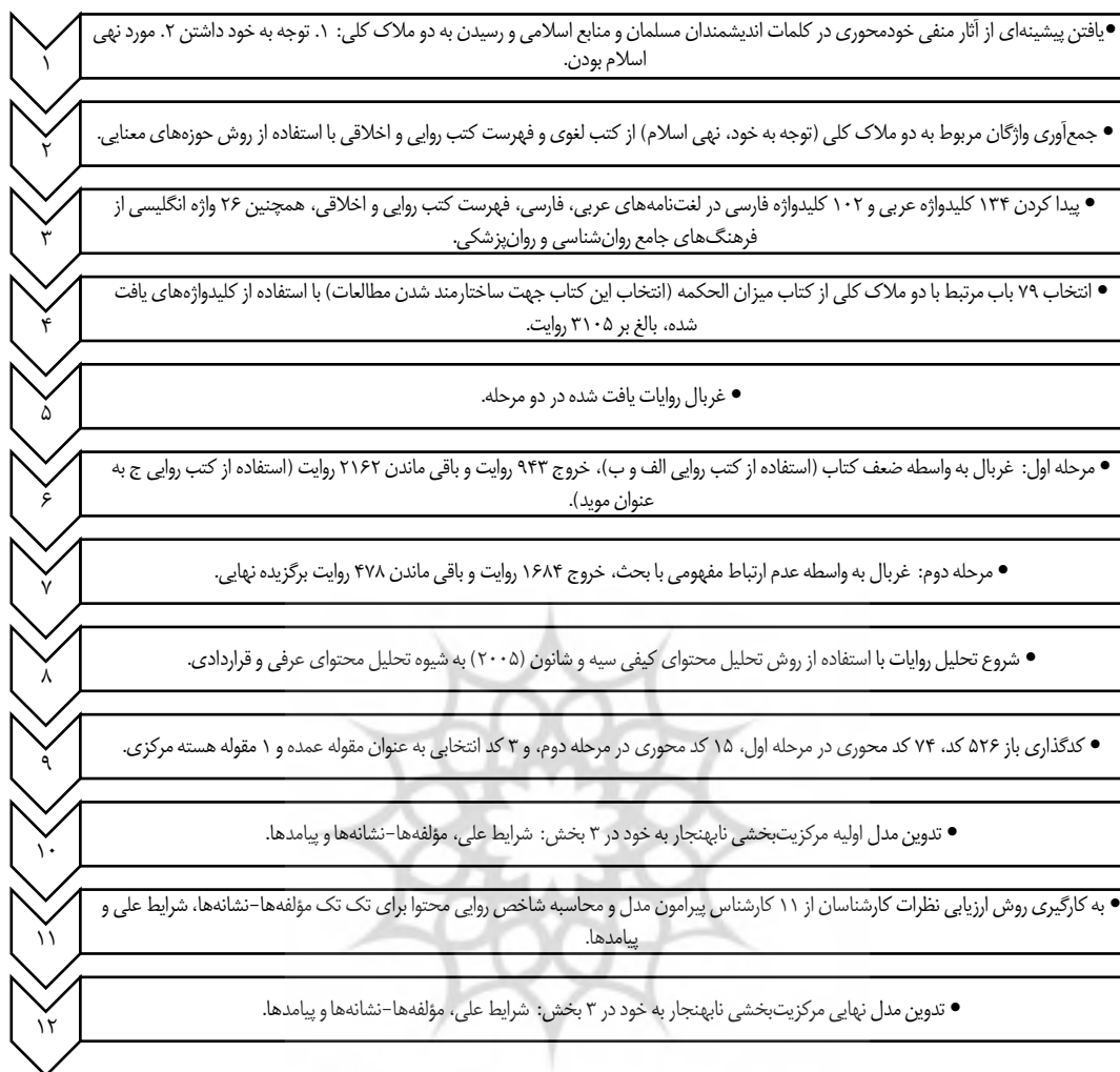
شکل ۲: چارت روند مراحل پژوهش