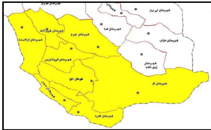
شکل ۲- موقعیت جغرافیایی شهرستان فیروزآباد در استان فارس