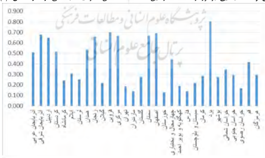
شکل ۲. میانگین شاخص برآوردی سرمایه اجتماعی در استان‌های مختلف طی دوره زمانی ۱۳۸۶-۱۳۹۴

مطالعه از این دو نوع تابع عضویت استفاده شده است. ۲ با توجه به آنچه که در روش‌شناسی و ادبیات وجود دارد و ورودی‌ها و قواعد فازی بیان شد می‌توان نتایج حاصل از برآورد شاخص سرمایه اجتماعی را در شکل (۲) مشاهده نمود.