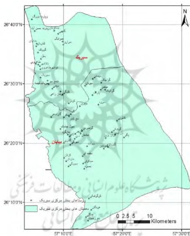
نقشه ۳ نقشه دهستان‌ها و روستاهای بخش مرکزی شهرستان سیریک

بندر سیریک در کنار دریای عمان با شن‌های سفید و نقره‌ای بکر و سواحل گسترده ماسه‌ای و آب‌های زلال آبی در پهنه کبود دریای است. در سیریک از هیاهوی شهرنشینی بزرگ اثری نیست. بخش مرکزی به مرکزیت شهر سیریک دارای دو دهستان به نام‌های دهستان سیریک به مرکز شهر سیریک و بیابان به مرکزیت گونمردی و مشتمل بر ۶۱ روستا است. منطقه‌ی مورد مطالعه و پژوهش یعنی بخش مرکزی سیریک، در استان هرمزگان در مجموع با ۶۱ آبادی دارای سکنه، ۸۲۵۰ خانوار و ۳۱۱۸۵ نفر جمعیت قرار دارد (زارعی، ۱۳۹۵).