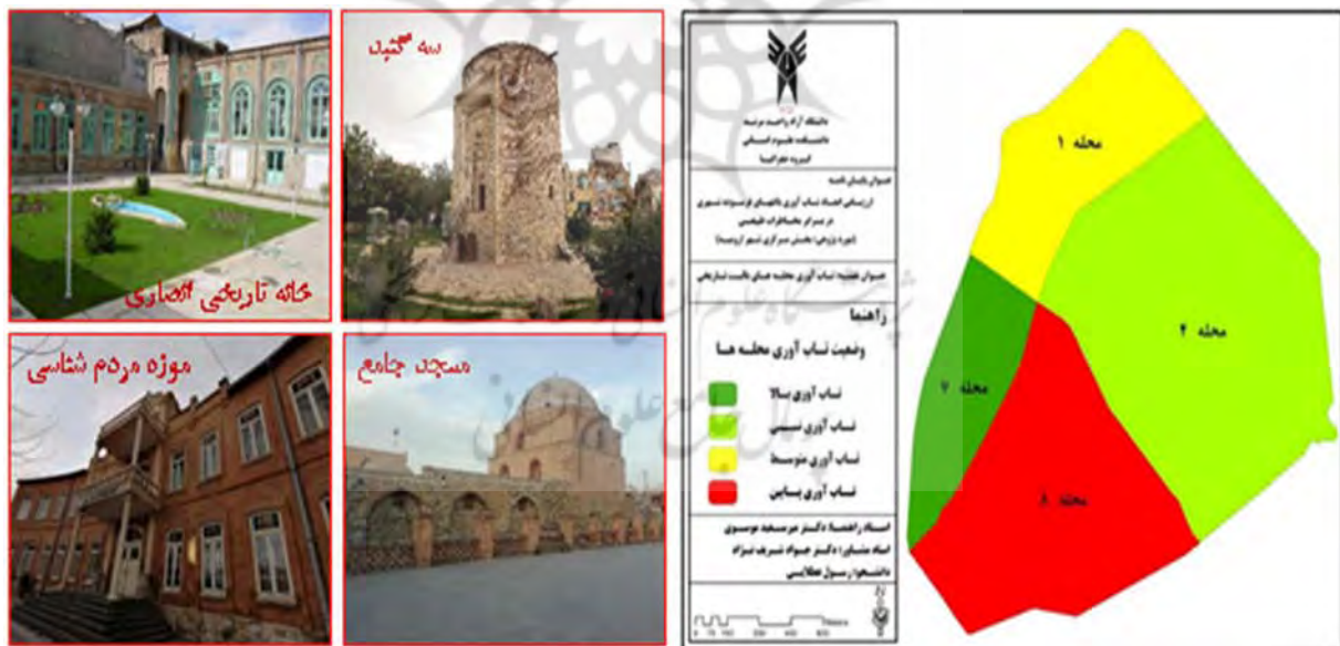
نقشه ۲- وضعیت محله‌های بخش مرکزی شهر ارومیه به لحاظ ابعاد چهارگانه تاب‌آوری و نمونه‌هایی از بافت تاریخی و گردشگری آن

تحلیل فضایی تاب‌آوری کالبدی بخش مرکزی (بافت تاریخی) شهر ارومیه: به منظور سنجش سطح تاب‌آوری کالبدی در بافت تاریخی شهر ارومیه از ۶ معیار اصلی (تعداد طبقات، قدمت ابنیه، کیفیت ابنیه، نوع مصالح ساختمانی، دسترسی به فضاهای باز، دسترسی به مراکز درمانی) که هر کدام دارای زیرمعیارهایی نیز می‌باشند (جدول ۸) و با استفاده از مدل AHP و نرم‌افزار ARC GIS تحلیل فضایی صورت گرفته است.