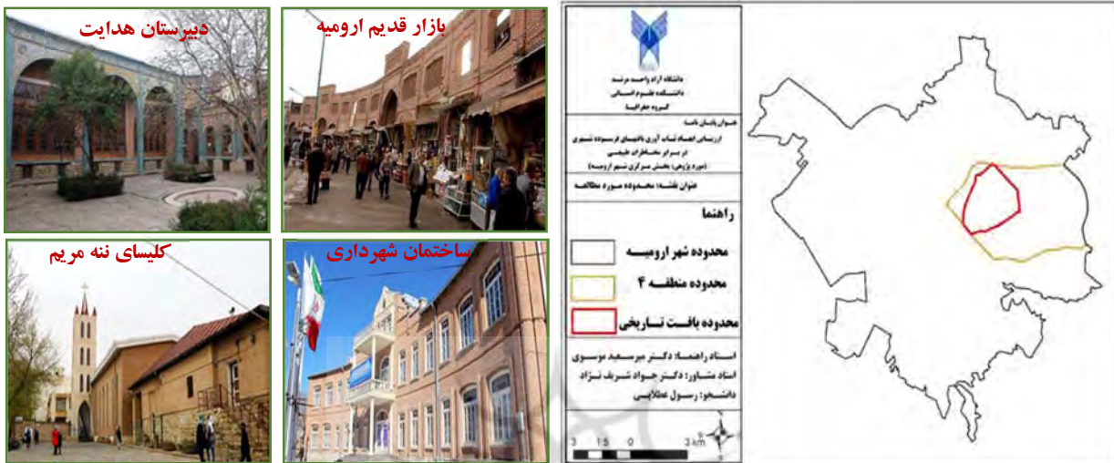
نقشه ۱- محدوده مورد مطالعه و نمونه‌هایی از بافت تاریخی و گردشگری واقع در آن

محدوده مورد مطالعه در این پژوهش بخش مرکزی (بافت تاریخی) با مساحت ۲۷۷/۷ هکتاری شهر ارومیه واقع در منطقه ۴ شهرداری ارومیه می‌باشد. منطقه ۴ شهرداری بر اساس آخرین تقسیمات کالبدی شهر ارومیه دارای ۳ ناحیه و ۱۲ محله می‌باشد. که محدوده مورد مطالعه شامل محله‌های ( ۱، ۴، ۷ و ۸ ) منطقه ۴ شهرداری ارومیه می‌باشد. جمعیت این محدوده برابر با ۴۲۱۷۵ نفر می‌باشد.