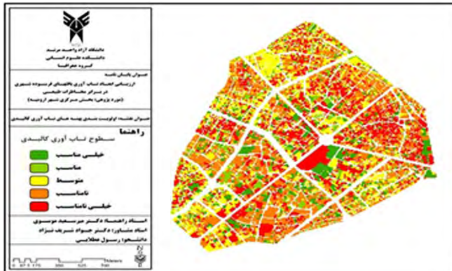
نقشه ۳- اولویت بندی پهنه‌های تاب‌آوری کالبدی