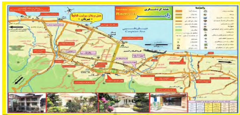
شکل شماره (۲). نقشه کاربری زمین و موقعیت فضایی شهر رامسر.

دریا و جنگل این منطقه را به عنوان قطب مهم گردشگری در کشور و حتی جهان مطرح کرده است. آب و هوای این منطقه جلگه‌ای معتدل، مرطوب و کوهستانی سرد و نیمه مرطوب است و اقتصاد آن بر پایه کشاورزی، دامداری و صنعت گردشگری استوار می‌باشد. وجود فرودگاه در شهر رامسر، و جنگل در شهرستان رامسر در غرب مازندران از دیگر ویژگی‌های این منطقه محسوب می‌شود (به نقل از مرکز آمار ایران).