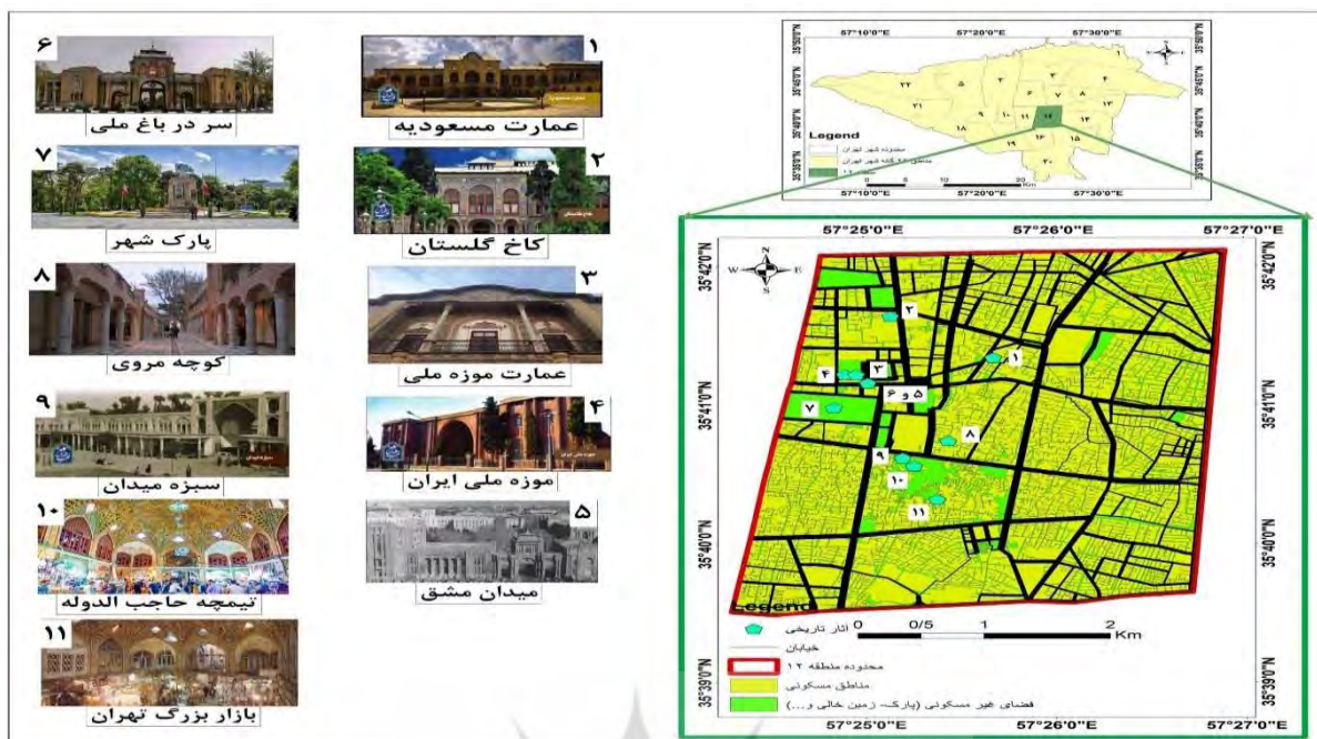
نقشه شماره ۲ - نقشه گردشگری منطقه ۱۲ تهران