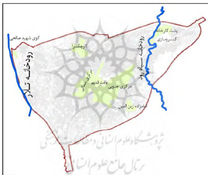
تصویر شماره ۲: تدقیق محدوده بافت فرسوده شهر قائمشهر ۲