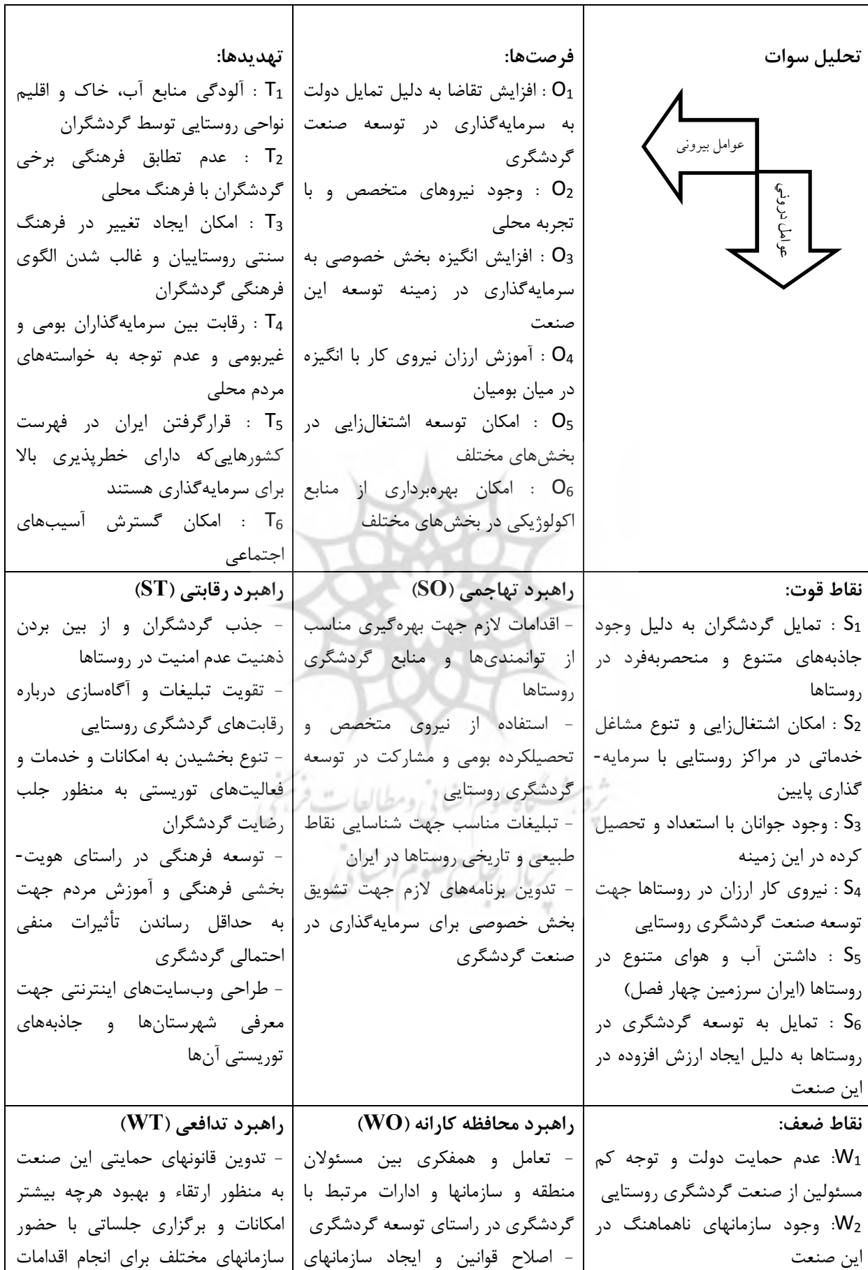
جدول ۹- ماتریس استراتژی‌ها (سوات)