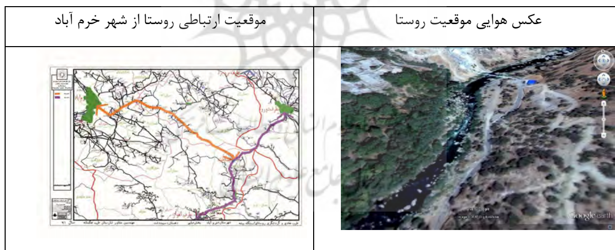
عکس شماره ۱: موقعیت جغرافیایی و ارتباطی روستای بیشه در منطقه

روستای ایستگاه بیشه به لحاظ تقسیم‌بندی ژئومورفولوژی در موقعیت دره‌ای واقع شده که به جهت موقعیت خاص استقرار، باعث شکل‌گیری بافت روستا بصورت متراکم شده است. روستای ایستگاه بیشه به لحاظ موقعیت نسبی جنوب غربی به روستای ده سفید و از شمال به روستای پسیر و از شرق به روستای چشمه پریان و از جنوب به روستای سماقها محدود شده است این نحوه استقرار روستا و دسترسی به مسیرهای ارتباطی امکان توسعه روستا در زمانهای مختلف فراهم می‌کند.