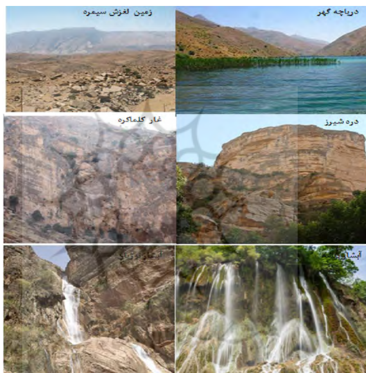
شکل ۲: محدوده‌های مورد بررسی جهت احداث ژئوپارک در محدوده‌ی شهرهای منتخب استان لرستان

طبق بررسی‌های به‌عمل آمده و ارزیابی پرسشنامه‌ها، ارزش هر یک از معیارها برای ژئومورفوسایت‌های مورد مطالعه که شامل دریاچه گهر در شهرستان درود، آبشار بیشه و نوژیان در شهرستان خرم‌آباد، غار کلماکره و زمین لغزش سیمره در شهرستان پلدختر و دره شیرز در شهرستان کوهدشت می‌باشند (شکل ۲)، مشخص و محاسبه گردید. بر اساس برآوردهای به‌عمل آمده، دریاچه گهر با میانگین ۱۵,۹۹ بیشترین و غار کلماکره با ۱۲,۵۳ کمترین امتیاز را دارند. هم‌چنین لندفرم‌های آبشار بیشه، دره شیرز، آبشار نوژیان، زمین لغزش سیمره در رده‌های دوم تا پنجم قرار گرفتند (جدول ۲).