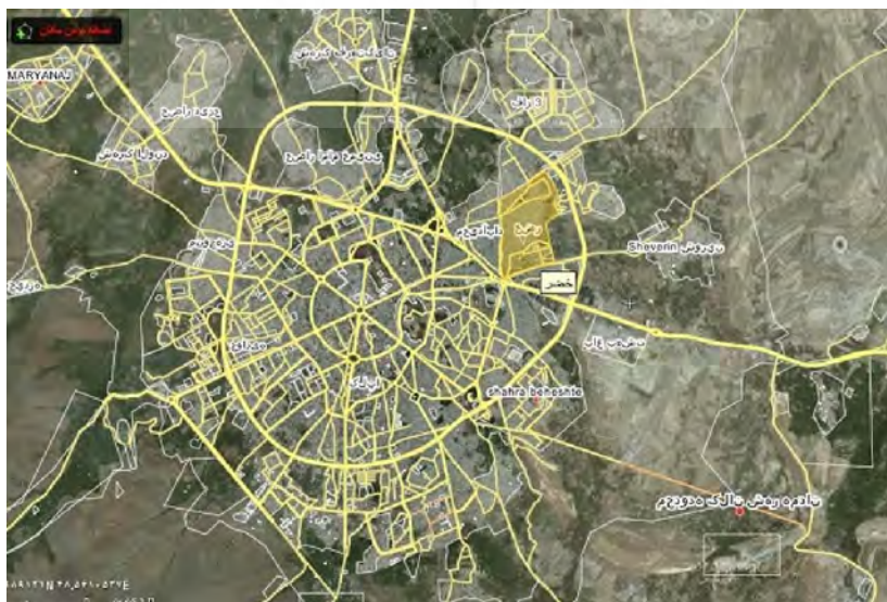
شکل ۲- محدوده هوایی شهر همدان

همدان با مساحت ۱۹۵۴۷ کیلومترمربع بین 33^{\circ} 33' تا 35^{\circ} 38' عرض شمالی و 47^{\circ} 45' تا 49^{\circ} 36' طول شرقی از نصف النهار گرینویچ قرار گرفته است. در حال حاضر استان همدان به دلیل داشتن مراکز تاریخی و دیدنی به عنوان پنجمین شهر فرهنگی و توریستی کشور شناخته شده است. از جمله اماکن تاریخی مهم کتیبه‌های گنجانمه، تپه‌های تاریخی هگمتانه و مصلی، آرامگاه‌های ابن سینا و باباطاهر، گنبد علویان، برج قربان، مجسمه شیر سنگی، آرامگاه استرومردخای و غیره می‌توان نام برد. از مناظر بدیع و طبیعی و دیدنی نیز می‌توان از غار زیبای علیصدر، آبشار گنجانمه، باغ‌های مصفای دامنه الوند به ویژه دره عباس‌آباد و دره مرادیگ، تپه عباس‌آباد، سد اکباتان و پارک مردم می‌توان سخن به میان آورد.