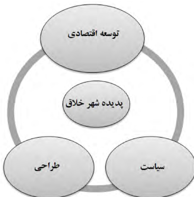
شکل ۱- هنر و فرهنگ به عنوان یک موتور شهری (Shoshanah B.D, 2018)