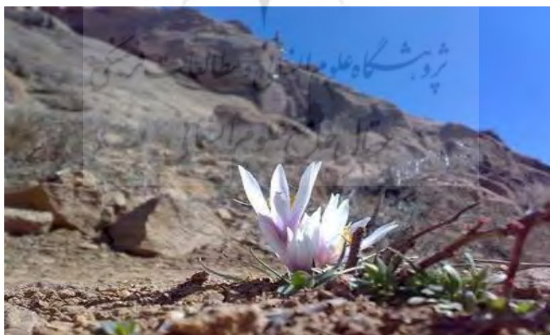
شکل ۳: دامنه‌های شمالی و جنوبی الوند

در دامنه‌های شمالی الوند دره‌های پر آبی مانند: دره برفین، دره گنجنامه، دره عباس آباد، دوزخ دره، دره گوساله، دره کیوارستان، دره سیمین دره، دره مراد بیگ، دره دیوین، دره قز، دره حیدریه و غیره وجود دارد و دره‌های مصفایی نیز در دامنه جنوبی الوند واقع است، از جمله دره سرکان، دره آرتیمانی، دره فاران، دره گزندر، دره شهرستانه و غیره.