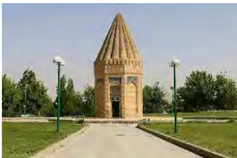
شکل ۵ مقبره حقیوق نبی در توسیرکان