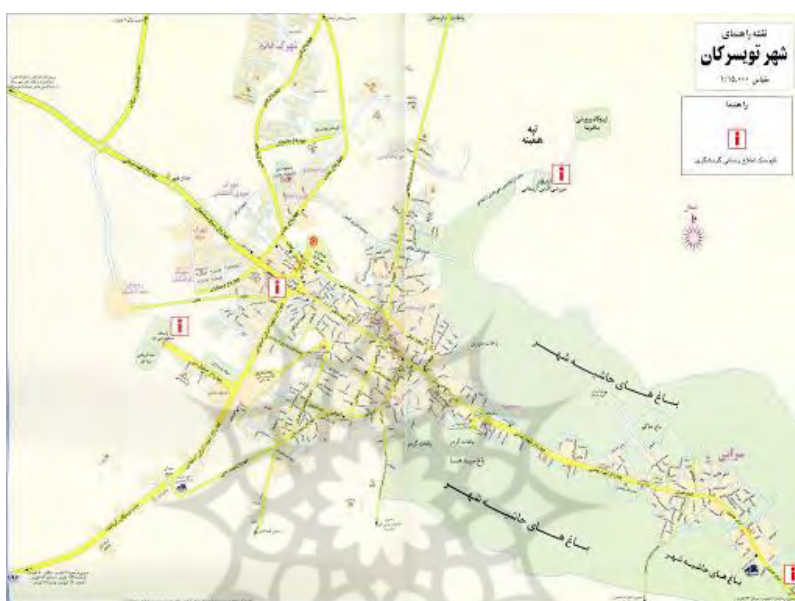
شکل ۲: نقشه مراکز گردشگری شهر تویسرکان

یکی از محبوب‌ترین محصولات تویسرکان گردو است و درخت‌های گردو زیادی در این شهر دیده می‌شود