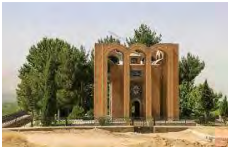
شکل ۶ آرامگاه میر رضی آرتیمانی