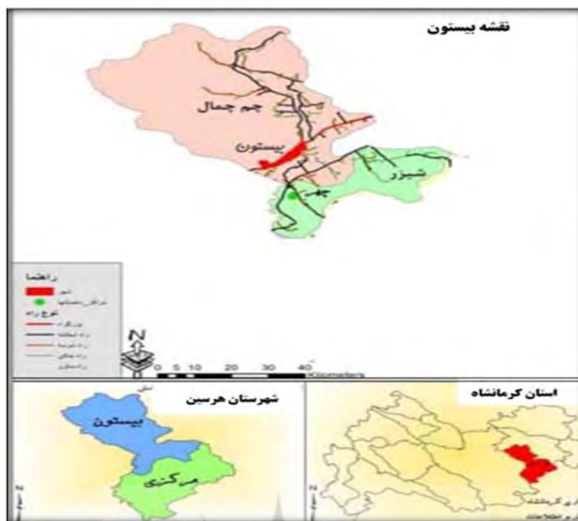
نقشه ۱: موقعیت شهر بیستون در تقسیمات سیاسی استان کرمانشاه