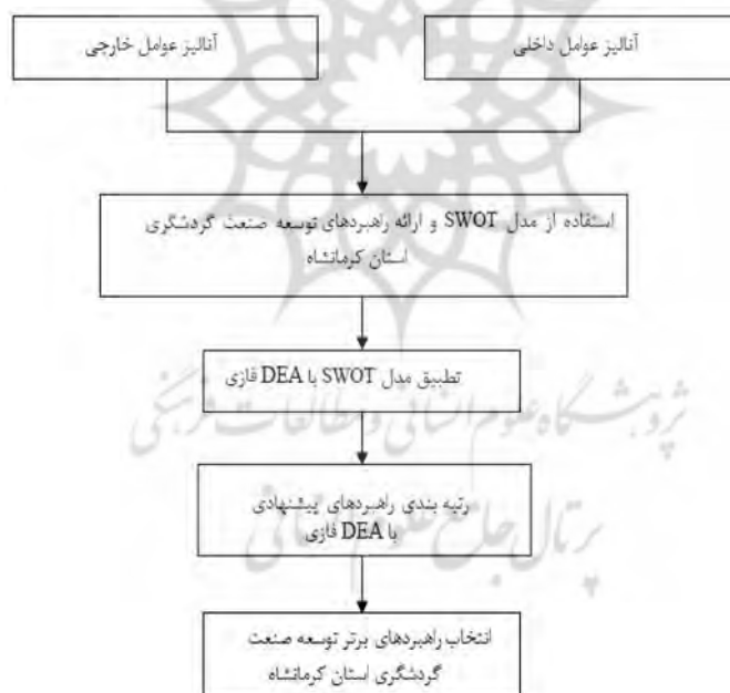
شکل ۱- مدل مفهومی تحقیق (نگارنده)

کارشناسان و مدیران و فعالان حوزه گردشگری استان کرمانشاه بوده که با توجه به اندک بودن تعداد اعضای جامعه؛ تعداد اعضای نمونه برابر ۲۳ نفر از کارکنان و مدیران مشغول به فعالیت در ادارات مرکزی میراث فرهنگی و گردشگری این استان بوده است. برای شناسایی مجموعه عوامل داخلی و خارجی فرا روی توسعه گردشگری در استان مورد مطالعه از نظر خبرگان (۱۲ خبره از جامعه آماری) و از طریق پرسشنامه استفاده شد که در نهایت به ترتیب: تعداد ۱۰ نقطه قوت، تعداد ۸ نقطه ضعف، ۱۰ تعداد فرصت و تعداد ۹ تهدید شناسایی و به عنوان عوامل نهایی استخراج شدند. همچنین با استفاده از ماتریس SWOT آنالیزها بر روی عوامل داخلی و خارجی شناسایی شده انجام شده و راهبردهای چهارگانه مطابق با مدل SWOT استخراج گردید. در ادامه عوامل داخلی و خارجی شناسایی شده مورد تجزیه و تحلیل قرار گرفتند. سپس با بهره‌گیری از نظر خبرگان نیز ۱۷ راهبرد با توجه به موقعیت راهبردی گردشگری استان کرمانشاه ارائه شد. سپس در یک پرسشنامه محقق ساخته؛ راهبردها بین اعضای نمونه توزیع و نظرات اعضای نمونه درباره اهمیت هر یک از راهبردها جمع‌آوری شد. همچنین با استفاده از روش تحلیل پوششی داده‌های فازی با توجه به اهداف تعریف شده؛ رتبه‌بندی عوامل با روش CCR در نرم افزار متلب انجام و نیز راهبردهای پیشنهادی با آنالیز نتایج پردازش‌ها انجام شد. ضمن آنکه برای انجام پردازش‌های از قابلیت‌های نرم افزار SPSS نسخه ۲۵ و اکسل استفاده شده است. در شکل ۱؛ مدل مفهومی تحقیق و گام‌های آن آورده شده است.