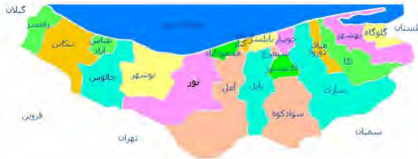
نقشه شماره ۱: نقشه استان مازندران به تفکیک شهرستان

شهرستان نور در سال‌های نه‌چندان دور با نام سولده بخشی از شهرستان آمل بوده است. این شهرستان پس از جدا شدن از آمل دارای سه بخش مرکزی، بلده و چمستان می‌باشد. بخش مرکزی شهرستان نور شامل شهرهای نور (مرکز شهرستان)، رویان (علمده) و ایزدشهر می‌باشد. بخش بلده نیز به مرکزیت شهری قدیمی به همین نام در ۸۵ کیلومتری جنوب شهر نور قرار دارد و پل ارتباطی میان دو جاده مهم هراز و چالوس است.