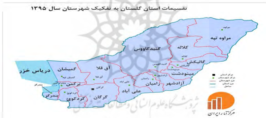
شکل ۱-

استان گلستان با مساحت حدود ۲۰۳۶۷ کیلومتر مربع بین ۳۶ درجه و ۲۵ دقیقه تا ۳۸ درجه و ۸ دقیقه عرض شمالی از استوا و ۵۳ درجه و ۵۰ دقیقه تا ۵۶ درجه و ۱۱ دقیقه طول شرقی از نصف النهار گرینویچ قرار گرفته است. مساحت آن بیشتر از ۷۰ کشور جهان و ۱۰ استان دیگر کشور می‌باشد. این استان از شمال به جمهوری ترکمنستان از شرق به استان خراسان از جنوب به استان سمنان و از غرب به استان و دریای مازندران محدود می‌شود. بر اساس آخرین تقسیمات اداری و سیاسی کشور استان گلستان از ۱۴ شهرستان ۲۹ شهر ۲۷ بخش ۶۰ دهستان تشکیل شده است (سایت مرکز آمار ایران، ۱۳۹۵). در استان گلستان به دلیل ساختار طبیعی خاص آن و موقعیت جغرافیایی ویژه‌ای که دارد عوامل اقلیمی-توپوگرافی-پوشش انبوه جنگلی-چشم‌انداز- و قابلیت‌های ویژه طبیعی نقش برجسته‌ای در منطقه بندی قطب‌های گردشگری ایفا می‌کنند. بدیهی است راه‌های ارتباطی نیز که اصلی‌ترین وسیله دسترسی به جاذبه‌های گردشگری هستند از اهمیت به سزایی برخوردارند. علی‌هذا با توجه به امکانات و پتانسیل‌های طبیعی فرهنگی استان که در حد امکان ارائه شد، می‌توان استان گلستان را در یک تقسیم بندی اولیه به ۴ کلان حوزه‌ی گردشگری ساحلی- جلگه‌ای- جنگلی و کوهستانی و ارتفاعات تقسیم کرد (شاهکویی، ۱۳۹۰: ۵۶-۵۵).