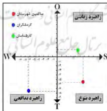
شکل ۲- موقعیت راهبردهای تحلیل SWOT از نظر گروه‌های آماری

بدین ترتیب، ساکنین شهرستان معتقدند که باید جاذبه‌های گردشگری شهرستان را احیاء، بازسازی و شناسایی نمود و در این مسیر باید عوامل خارجی مانند سیاست‌گذاری و سرمایه‌گذاری‌های دولتی و خصوصی کمک گرفته شود. در حالی که گردشگران معتقدند باید کاستی‌ها و محدودیت‌ها را جبران کرد و این کار نیازمند همکاری متقابل مردم شهرستان و دولت برای ارتقاء صنعت گردشگری منطقه است. از نظر کارشناسان نیز توسعه نقاط قوت و فرصت برای گردشگری منطقه از ضروریات اساسی است.