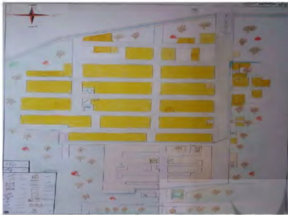
شکل شماره ۲: شماتیک روستای قردين

قردين در 37^{\circ} 17' تا 50^{\circ} 36' ، 29^{\circ} 50' شرقی و 34^{\circ} 24' تا 34^{\circ} 36' ، 00' شمالی در ۱۰ كيلومتری جنوب ساوه و ۱۲۵ كيلومتری جنوب غربی تهران در بخش مرکزی، در دهستان نوعلی بیگ شهرستان ساوه به امر کیخسرو ساخته شده است. آورده‌اند چون به کوه اندیس و ماهین رسید دستور به ساخت بنا داد و چون به اوامر خود گفت: "کردید این" به مرور زمان به قردين تغيير نام یافته است (قمی، ۱۳۶۱: ۸۱) (شکل شماره ۱ و ۲).