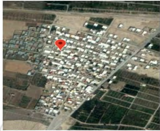
شکل شماره ۱: نقشه ماهواره‌ای روستای قردين