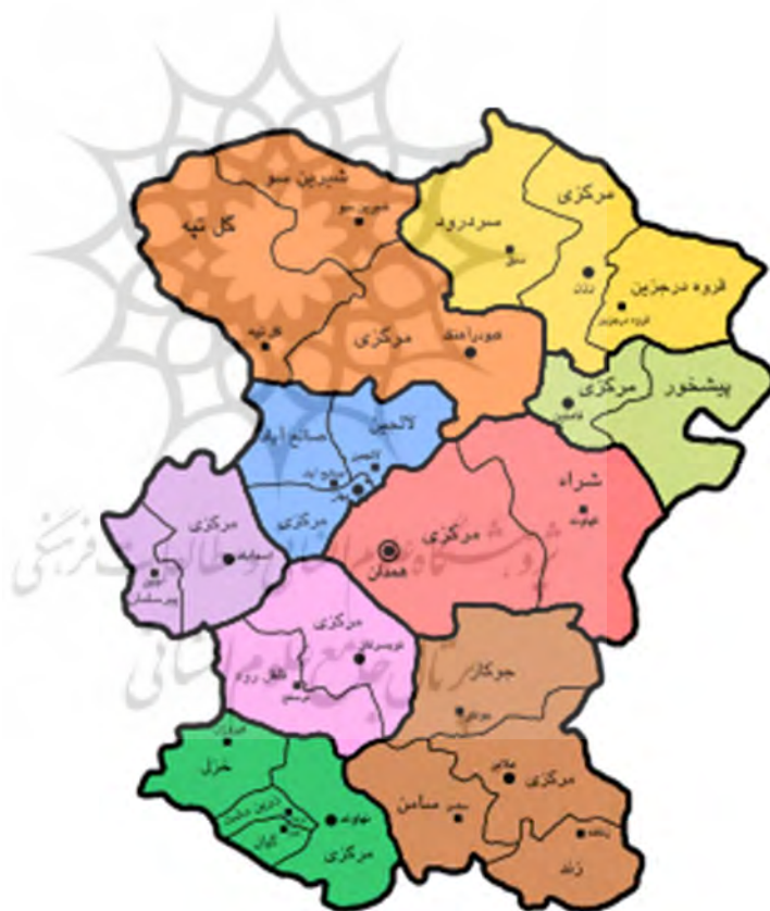
تصویر شماره (۲)، موقعیت قرار گیری شهرستان های استان همدان