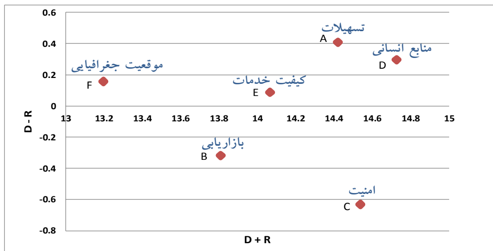
(شکل ۴) نمودار علی روابط و اهمیت شاخص‌ها