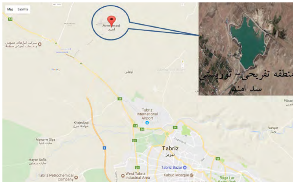
(شکل ۲) نمای هوایی از موقعیت سد امند