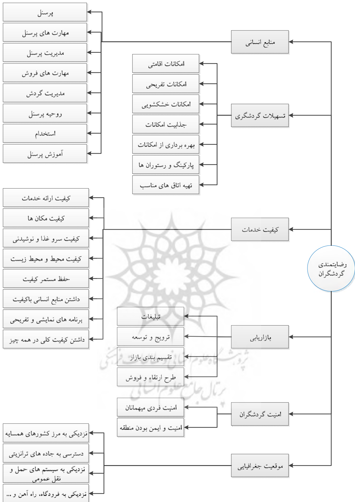
(شکل ۳) عوامل مؤثر بر رضایتمندی گردشگران در منطقه تفرجگاهی سد امند