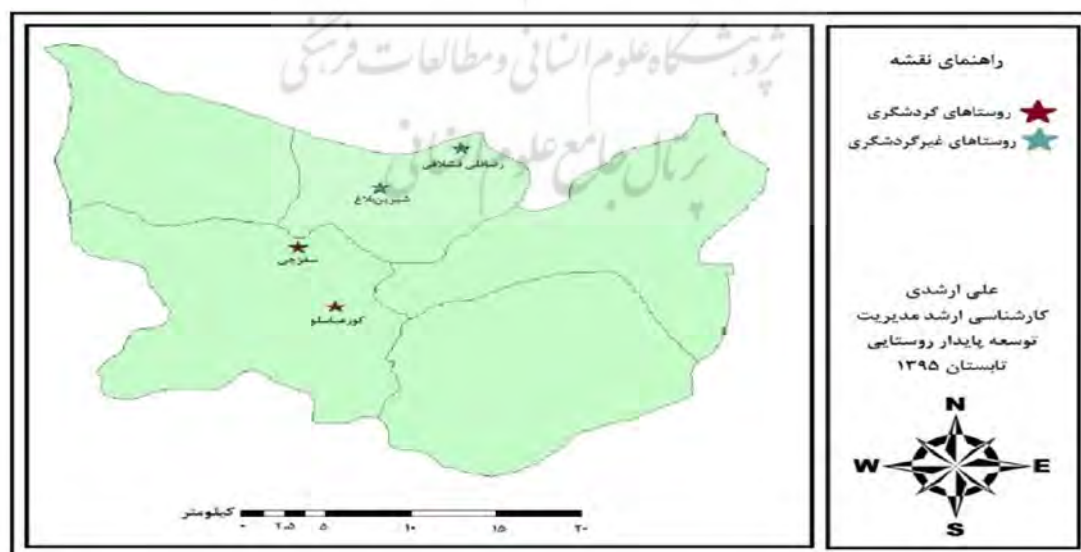
شکل (۳): موقعیت روستاهای مورد مطالعه (ترسیم: نگارنده، ۱۳۹۵)

محدوده مورد مطالعه در این تحقیق شهرستان نیر و ۴ روستاهای انتخابی (کورعباسلو، سقزچی، شیرین‌بلاغ و رضاقلی قشلاقی) می‌باشد. طبق سرشماری عمومی نفوس و مسکن ۱۳۹۰، تعداد ۲۳/۶۵۶ نفر در شهرستان نیر زندگی می‌کنند. از این تعداد ۱۲/۱۸۸ نفر (۵۱/۵۲٪) را مردان و ۱۱/۴۶۸ نفر (۴۸/۴۸٪) را زنان تشکیل می‌دهند. از این تعداد جمعیت ۶/۶۷۴ نفر (۲۸/۲۱٪) را نقاط شهری و ۱۶/۹۸۲ نفر (۷۱/۷۹٪) را نقاط روستایی در خود جای داده‌اند (سالنامه آماری، ۱۳۹۰). هم‌چنین از کل جمعیت روستایی این شهرستان ۸/۸۱۸ نفر (۵۱/۹۳٪) را جنس مرد و ۸/۱۶۴ نفر (۴۸/۰۷٪) را جنس زن تشکیل داده‌اند. در این میان ۲ روستای کورعباسلو و سقزچی، بر اساس سرشماری عمومی نفوس و مسکن ۱۳۹۰ جمعاً دارای ۳۸۴ نفر جمعیت بوده که از این تعداد ۲۰۰ نفر را مردان و ۱۸۴ نفر را زنان تشکیل داده‌اند و به دلیل دارا بودن جاذبه‌های گردشگری هم‌چون دره بوینی یوغون «گردن کلفت» و نوع معماری خاص بناها (روستای کورعباسلو) و چشمه‌های آب‌گرم ایستی سو و دیب‌سبیزگول (روستای سقزچی) و هم‌چنین رونق نسبی اقتصاد این روستاها به دلیل وجود این پتانسیل‌ها، به عنوان روستاهای گردشگری انتخاب گردیده‌اند. هم‌چنین ۲ روستای رضاقلی قشلاقی و شیرین‌بلاغ، بر اساس سرشماری عمومی نفوس و مسکن ۱۳۹۰ با هم دارای ۳۱۲ نفر جمعیت بوده که از این تعداد ۱۵۹ نفر را مردان و ۱۵۳ نفر را زنان تشکیل داده‌اند و با وجود داشتن شرایط نسبتاً مناسب به دلیل عدم مدیریت مطلوب در حالت رکود نسبی قرار داشته و به همین دلیل به عنوان روستاهای فاقد گردشگر (گروه شاهد) انتخاب گردیده‌اند. موقعیت روستاهای مورد مطالعه در شکل (۳) نمایش داده شده است.