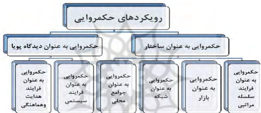
شکل (۲): رویکردهای نظری درباره حکمروایی: (منبع یافته‌های پژوهش، ۱۳۹۵)

بانک جهانی حکمروایی را چنین تعریف می‌کند: روشی برای اعمال قدرت بر مدیریت اقتصادی یک کشور و منابع اجتماعی آن به منظور رسیدن به توسعه تعریف می‌کند و یا آن را به عنوان سنت‌ها و نهادهایی تعریف می‌کند که توسط آن‌ها قدرت مطلوب جامعه تعریف می‌شود (World Bank, 2006: 76). هم‌چنین حکمروایی روستایی عبارت است از: فرایند تأثیرگذاری همه‌ی ارکان دخیل روستایی بر مدیریت روستایی، با تمام سازوکارهایی که با آن‌ها بتوان به سوی تعالی و پیشرفت روستا و مردم روستایی حرکت کرد. به عبارت دیگر، حکمروایی روستایی به اجرا درآوردن تصمیمات و سیاست‌های مردم روستایی، هم‌سو با منافع خودشان است که در عین حال با منافع ملی، منطقه‌ای و محلی نیز سازگار است (حیدری ساربان و همکاران، ۱۳۹۴: ۱۸۷).