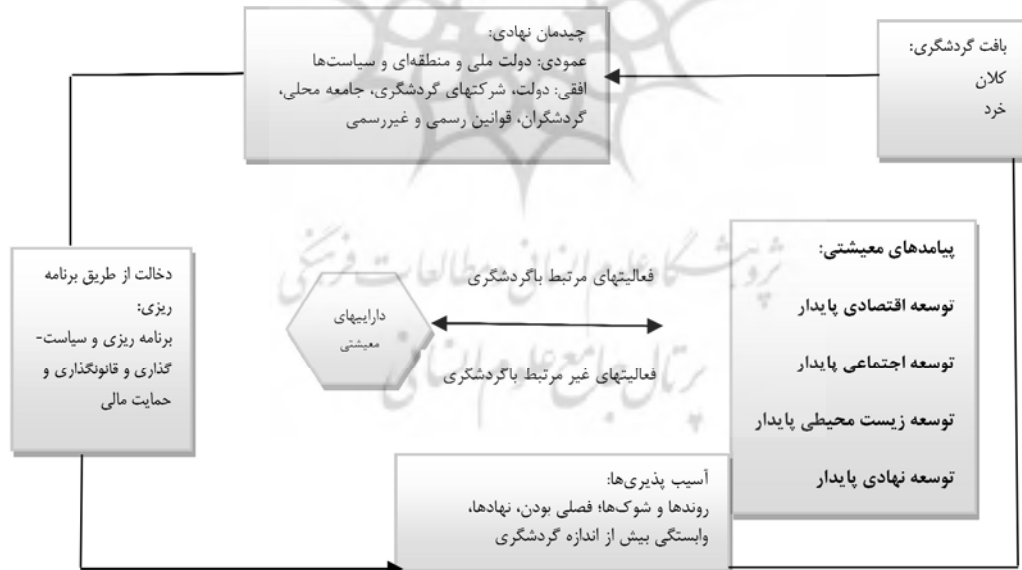
شکل ۱- چارچوب معیشت پایدار برای گردشگری

هزینه‌های زندگی، زیرساخت‌ها، در دسترس بودن خدمات آموزشی و بهداشتی، فرصت‌های آموزشی و دسترسی اطلاعات؛ توسعه اجتماعی پایدار (امنیت، فرهنگ، همبستگی جامعه، اعتماد، مهاجرت، تفریح و بهبود جایگاه زنان)؛ و همچنین توسعه پایدار زیست‌محیطی (جذابیت منطقه، آلودگی و زباله، منابع طبیعی و آگاهی‌های زیست‌محیطی)؛ و نیز توسعه پایدار نهادی (مشارکت در مدیریت گردشگری، دسترسی دموکراتیک و عادلانه به قدرت، ارتباطات و عادلانه بودن) تعریف کرده است (شن، ۲۰۰۹: ۷۸-۷۹). همچنین نتایج چنج و لی ۱ (۲۰۰۸) نشان می‌دهد گردشگری می‌تواند به عنوان یک منبع مالی جدید، معیشت اقتصادی مردم محلی را بهبود بخشد و با ایجاد اشتغال و افزایش درآمد در زدودن چشم‌انداز فقر در نواحی روستایی مؤثر واقع شود. گال ۲ و همکاران (۲۰۰۷) با استفاده از الگوی معیشت پایدار، نقش و جایگاه گردشگری در زندگی معیشتی مردم در منطقه روستایی در شیلی را جهت شناخت بیشتر و روشن کردن معنای مباحثی همچون پایداری، معیشت، گردشگری از نقطه نظر مردم جامعه روستایی مورد بررسی قرار داد. وی نیز الگویی برای بررسی ارتباط معیشت پایدار با توسعه گردشگری جهت بررسی و شناخت عناصر و ارتباطات میان معیشت (منابع، استراتژی‌ها و پیامدهای آن) در یک بافت گردشگری ارائه داده است. همچنین توسان (۲۰۰۲) نیز در مطالعه تطبیقی خود در یورگاپ (ترکیه)، نادای (فیجی) و فلوریدای مرکزی (آمریکا)، ایجاد فرصت‌های شغلی از طریق گردشگری روستایی را یکی از آثار مثبت گردشگری ذکر کرده است.