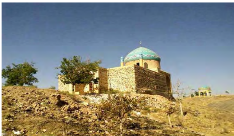
شکل ۴. امامزاده زکریا

در بخش خلجستان بین روستای عیسی آباد و میدانک، رود کوچک خشکی وجود دارد که در کنار آن از عمق ۵ متری سطح زمین، سدی آجری به صورت برجی از سنگ و گچ بنا شده است. ساختمان امامزاده زکریا در دوره صفویه بر روی این سد ساخته شد. نمای بیرونی این بقعه هشت ضلعی، با آجر و گچ ساخته شده است.