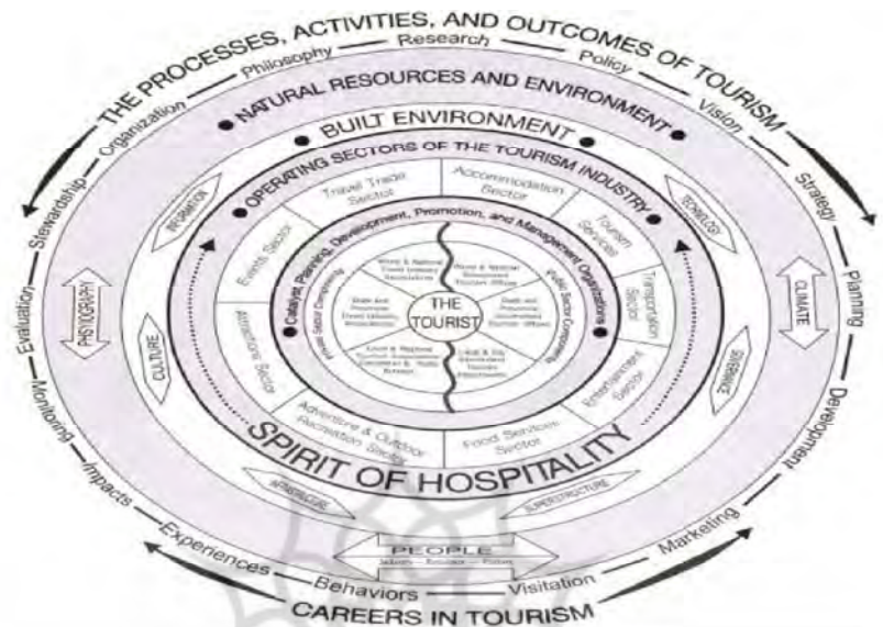
شکل ۱: اجزای اصلی گردشگری (گلدنر، ریچی، & برنت، ۱۳۹۲)

ترکیب اجزای مختلفی به وجود آمده است و به سادگی نمی‌توان آن را در قالب یک پدیده واحد تعریف کرد، از این رو بهتر است با توضیح اجزای تشکیل دهنده آن شناختی کاملتر از آن پیدا کنیم. به طور کلی، هر الگوی کاملی از گردشگری باید بتواند اجزای اصلی و نحوه ترکیب و ارتباط آن‌ها را باهم نشان دهد. شکل ۱ الگویی را نشان می‌دهد که اجزای اصلی گردشگری در آن درج شده است و اجزای اصلی تشکیل دهنده آن را مشخص می‌سازد.