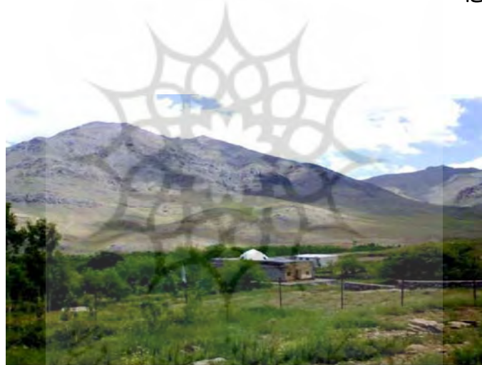
شکل ۳. امامزاده باوره

برخی از امامزاده‌های معروف استان که هر ساله توسط زائرین مورد بازدید قرار می‌گیرند، عبارتند از: مقبره امامزاده باوره، امامزاده زکریا، شاهزاده اسماعیل، زینب خاتون، حلیمه خاتون و اسحاق، شاهزاده حمزه، امامزاده سلیمان، شاهزاده ابراهیم، امامزاده عبدالله و .... در ادامه نمای تصویری برخی امامزاده‌های استان قم آورده شده است.