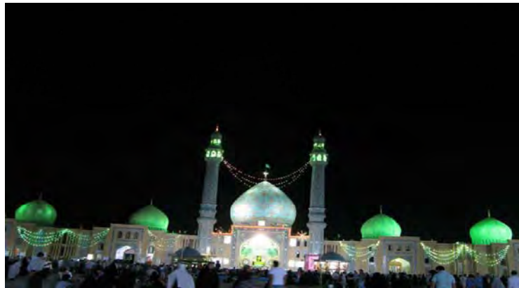
شکل ۶. مسجد مقدس جمکران