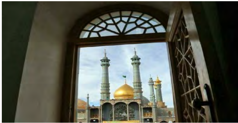
شکل ۲. نمایی از حرم حضرت معصومه

برخی از امامزاده‌های معروف استان که هر ساله توسط زائرین مورد بازدید قرار می‌گیرند، عبارتند از: مقبره امامزاده باوره، امامزاده زکریا، شاهزاده اسماعیل، زینب خاتون، حلیمه خاتون و اسحاق، شاهزاده حمزه، امامزاده سلیمان، شاهزاده ابراهیم، امامزاده عبدالله و .... در ادامه نمای تصویری برخی امامزاده‌های استان قم آورده شده است.