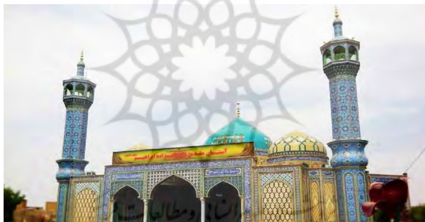
شکل ۵. امامزاده ابراهیم

در بخش خلجستان بین روستای عیسی آباد و میدانک، رود کوچک خشکی وجود دارد که در کنار آن از عمق ۵ متری سطح زمین، سدی آجری به صورت برجی از سنگ و گچ بنا شده است. ساختمان امامزاده زکریا در دوره صفویه بر روی این سد ساخته شد. نمای بیرونی این بقعه هشت ضلعی، با آجر و گچ ساخته شده است.