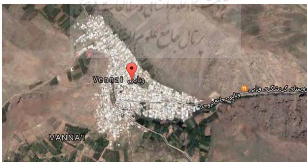
تصویر شماره ۱- موقعیت روستای ونایی