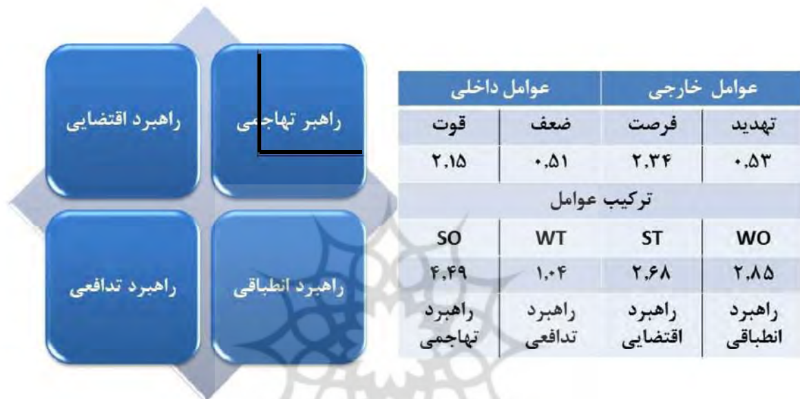
شکل ۱- تعیین راهبرد مطلوب توسعه پایدار گردشگری و ترکیب آن.

تجزیه و تحلیل عوامل درونی (قوت‌ها و ضعف‌ها) و عوامل بیرونی (فرصت‌ها و تهدیدها) حاکی از این است که راهبرد تهاجمی (حداکثر-حداکثر)، با امتیاز ۴/۴۹ به‌عنوان مهم‌ترین راهبرد توسعه پایدار گردشگری در این روستا مطرح می‌باشد. راهبردهای انطباقی (حداقل-حداکثر)، اقتضایی (حداکثر-حداقل) و تدافعی (حداقل-حداقل)، به ترتیب با امتیاز نهایی ۲/۲، ۶۸/۸۵، ۱/۰۴ در رده‌های بعدی قرار دارند. در ادامه، مهم‌ترین موارد در هر راهبرد برای توسعه و پیشبرد موضوع مورد بحث در زمینه به‌کارگیری توسعه پایدار گردشگری در روستای ونایی بیان می‌گردد.