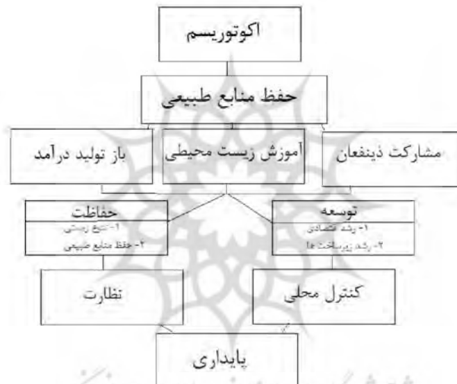
شکل ۱: اکوتوریسم و توسعه پایدار (یافته‌های پژوهش، ۱۳۹۵)

در تعریف سازمان ملل از توسعه پایدار چنین آمده است: توسعه پایدار آن گونه توسعه‌ای است که از نظر اقتصادی پویا و پربازده، از نظر زیست محیطی غیرمداغ و غیرمخرب، از نظر اجتماعی عادلانه و قابل قبول و از نظر فن‌آوری متناسب و مطلوب باشد (امینیان و همکاران، ۱۳۹۱: ۶). براساس رویکرد نظری توسعه پایدار، اکوتوریسم می‌تواند به عنوان شکلی از گردشگری پایدار عمل کند و منفعت‌هایی را برای نسل حاضر و آینده به همراه آورد (دوها بوچسبام، ۱۳۸۴: ۲). زیرا امروزه بیشتر مناطق طبیعی باقیمانده از چند راه حفاظت می‌شوند، که اکوتوریسم یکی از آنهاست. اصولاً اکوتوریسم راهبردی است برای کنترل حفاظت شده. این نوع گردشگری با هدف چندجانبه، یعنی حفاظت از محیط زیست، احترام به جوامع محلی و ارتقای مؤلفه‌های فرهنگی جوامع میزبان، سروکار دارد که این اهداف با مفهوم توسعه پایدار همخوانی دارند و شعار اصلی آن (سفر مسئولانه به مناطق طبیعی به منظور حفظ محیط زیست و بهبود اوضاع اقتصادی جوامع محلی) است (درام و مور، ۱۳۸۸: ۱)، (شکل ۱).