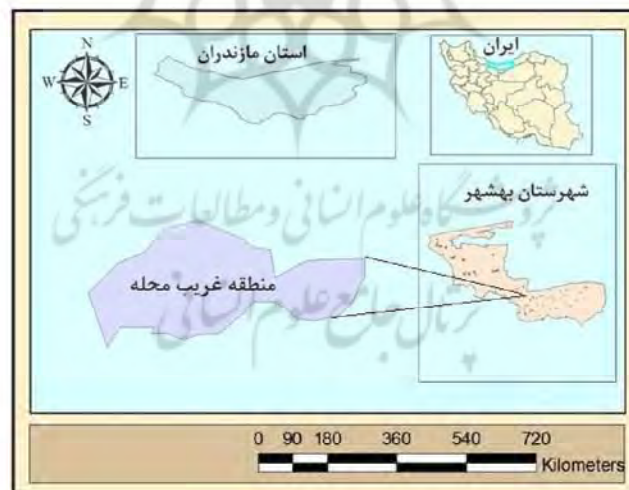
شکل ۳: موقعیت جغرافیایی منطقه مورد مطالعه (نگارندگان، ۱۳۹۵)

منطقه غریب محله در جنوب شهر بهشهر واقع در منطقه هزار جریب در میان کوههای سوچلما و جهانمورا که یک ناحیه کوهستانی است، می باشد. این منطقه از شمال به روستاهای پجیم، زلت، شیخ محله؛ از جنوب به محسن آباد و کفکور و از شرق به روستای گالش محله و از غرب به چالکده محدود می باشد. منطقه غریب محله بین ۵۳ درجه و ۴۰ دقیقه طول جغرافیایی و ۳۶ درجه و ۳۴ دقیقه عرض جغرافیایی قرار دارد. مساحت محدوده قانونی روستا ۵/۱ کیلومترمربع و مساحت محدوده خدماتی و خارج از محدوده خدماتی به ۳۵ کیلومترمربع است (شکل ۳).