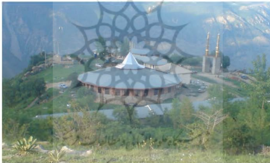
شکل (۳) : امام زاده عبدالمناف و عبدالمطلب(ع)