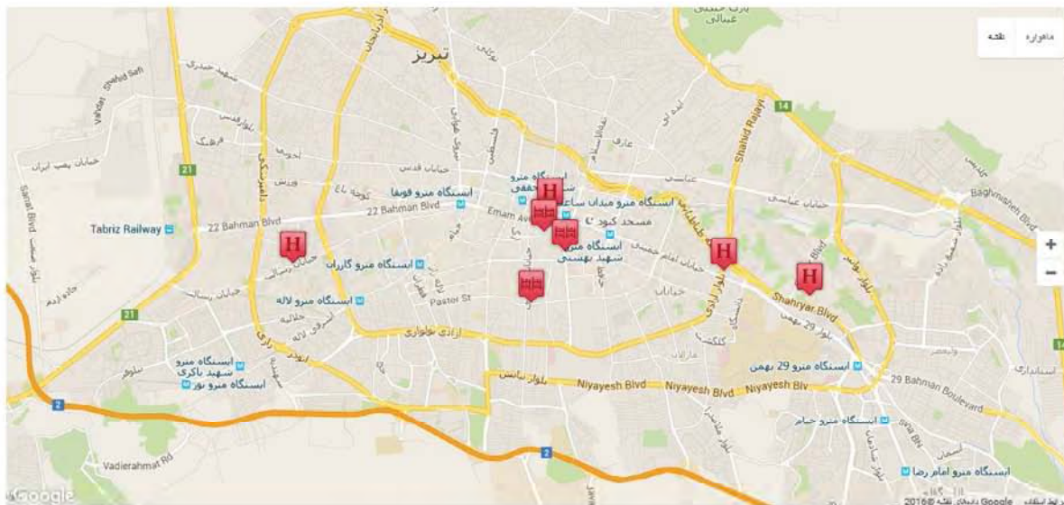
(شکل ۲. موقعیت هتل‌های تبریز)