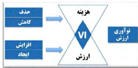
شکل ۳- فرآیند نوآوری ارزش (کیم و مابورنیا، ۲۰۰۵)

نوآوری ارزش، پایه و اساس استراتژی اقیانوس آبی است. نوآوری ارزش، تفکری نوین در زمینه استراتژی و اجرای آن است که به آفرینش اقیانوس‌های آبی خروج از اقیانوس‌های قرمز منتهی می‌شود. نوآوری ارزش یکی از متداول‌ترین اصول پذیرفته شده در استراتژی‌های مبتنی بر رقابت را به چالش می‌کشد: یعنی رابطه جایگزینی ارزش - هزینه نوآوری ارزش، بر روی هر دو مؤلفه نوآوری و ارزش تأکید یکسانی می‌نماید. شکل زیر فرآیند نوآوری ارزش را نشان می‌دهد.