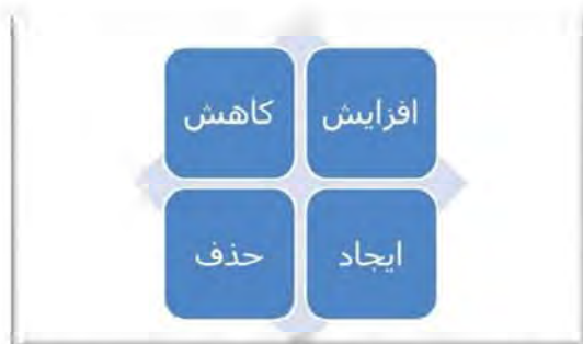
شکل ۴- الگوی تصمیم‌گیری چهار اقدامی (کیم و مابورنیا، ۲۰۰۵)

با پیگیری دو پرسش ابتدایی که حذف کردن و تقلیل یافتن است، این بینش بدست خواهد آمد که چگونه ساختار هزینه نسبت به رقبا کاهش پیدا کند. با پیگیری دو پرسش بعدی که افزایش دادن و خلق کردن است، این بینش به دست خواهد آمد که چگونه می‌توان ارزش قابل ارائه به مشتریان را بالا برده و منابع جدید تقاضا خلق کرد. از زمانی که الگوی تصمیم‌گیری چهار اقدامی را بر روی نقشه وضعیت استراتژی صنعت خود به کار گیرید، به روندی جدید و دیدگاهی بدیع دست خواهید یافت (کیم و مابورنیا، ۲۰۰۵، ص. ۲۴۰).