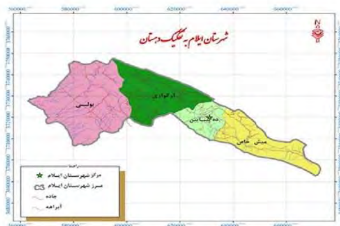
نگاره ۲. موقعیت شهرستان ایلام به تفکیک دهستان