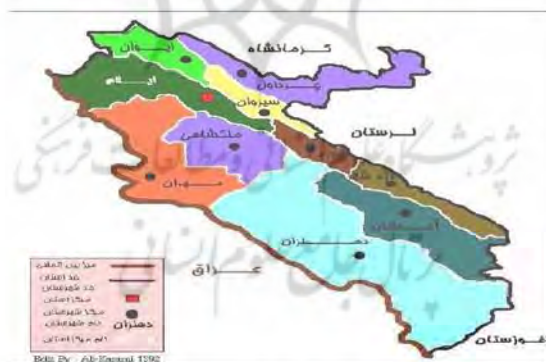
نگاره ۱. موقعیت شهرستان ایلام در سطح استان ایلام

حیدرآباد در دل دهستان میش خاص و در ناحیه جنوب غرب شهرستان ایلام قرار گرفته است. روستای حیدرآباد از ۳۰ کیلومتری شهر ایلام شروع شده و تا ارتفاعات طولاب در نزدیکی روستا امتداد دارد. آمیختگی جنگل و باغ‌های میوه، به خصوص درختان گردو، همراه با چشمه‌ها و رودهای خروشان، چشم‌اندازی زیبا به این دره بیلاقی بخشیده است. این دره هم از نظر جذب گردشگر و هم از نظر تولید محصولات باغی، از جمله منابع درآمدزا و مهم استان و روستاییان به شمار می‌آید. بافت این روستا نکات جالب توجهی دارد، چون در این روستا کوچه‌بندی شده و هر کوچه یک اسم دارد و موزاییک شدن کوه‌ها و تمیزی روستا نشان می‌دهد طرح هادی تا حدود زیادی در روستا اجرا شده است. در این روستا، ایستگاه مطبوعاتی، سطل زباله‌های مخصوص، سرویس بهداشتی، آب سرد کن و... وجود دارد و این روستا از جمله مناطق استان ایلام است که مردم در توسعه و اجرای طرح‌های مختلف آن مشارکت فعال دارند و هر ساله در دهه سوم خرداد، جشن برداشت زردآلود در این روستا برگزار می‌شود. در این جشن بهترین محصول و باغدار نمونه معرفی می‌شود. روستای کوهستانی حیدرآباد ۱۴۰۰ متر از سطح دریا ارتفاع دارد و اقلیم آن معتدل و کوهستانی است و در فصول بهار و تابستان و اوائل پاییز، هوایی معتدل و در زمستان هوایی سرد دارد. روستای حیدرآباد با داشتن طبیعت زیبا و ظرفیت‌های بالقوه طبیعی فراوان به عنوان یکی از قطب‌های اصلی گردشگری به شمار می‌رود. همچنین منطقه مورد مطالعه دارای جاذبه‌های طبیعی همچون چشمه‌ها، باغات میوه، زمین‌های کشاورزی مستعد، تپه و دشت‌های سرسبز، اردوگاه تفریحی، گیاهان دارویی، بافت معماری سنتی و ... می‌باشد.