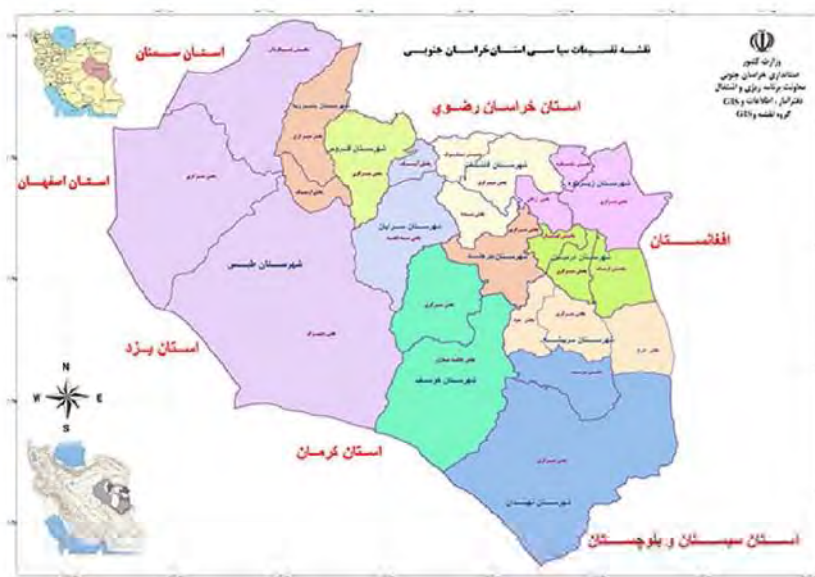
شکل (۲): موقعیت استان خراسان جنوبی در کشور

از لحاظ جاذبه‌های گردشگری، استان خراسان جنوبی، در مسیر محورهای ارتباطی استان‌های جنوبی ایران با مشهد قرار دارد. محور اصلی ارتباطی استان‌های یزد، کرمان، اصفهان، فارس، بوشهر و هرمزگان به مشهد، از طبس، بشرویه و فردوس می‌گذرد. همچنین محور ارتباطی استان سیستان و بلوچستان به مشهد از شهرهای نهبندان، سربیشه، بیرجند و قائن عبور می‌کند. یکی از قدیمی‌ترین جاذبه‌های گردشگری ثبت شده در استان خراسان جنوبی سنگ نگاره کال جنگال در ۵ کیلومتری جنوب شهر خوسف و متعلق به دوره اشکانی است که در بررسی‌های جدید ۱۴ سنگ نگاره در نزدیکی آن شناسایی شده است. از دیگر جاذبه‌های گردشگری استان می‌توان به ژئوتوریسم و جاذبه‌های کویری، روستاهای هدف و مناطق نمونه گردشگری استان و مجتمع‌های آبدرمانی اشاره کرد (جدول ۱). (اداره کل میراث فرهنگی و صنایع دستی و گردشگری خراسان جنوبی). همچنین در این استان میراث فرهنگی، معنوی و طبیعی وجود دارد که جزء آثار ملی به ثبت رسیده است.