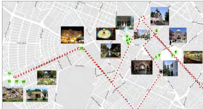
شکل (۱) مسیر پیشنهادی ۱