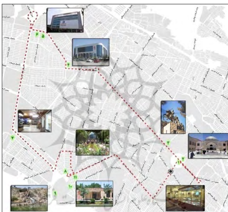
شکل (۲) مسیر پیشنهادی ۲